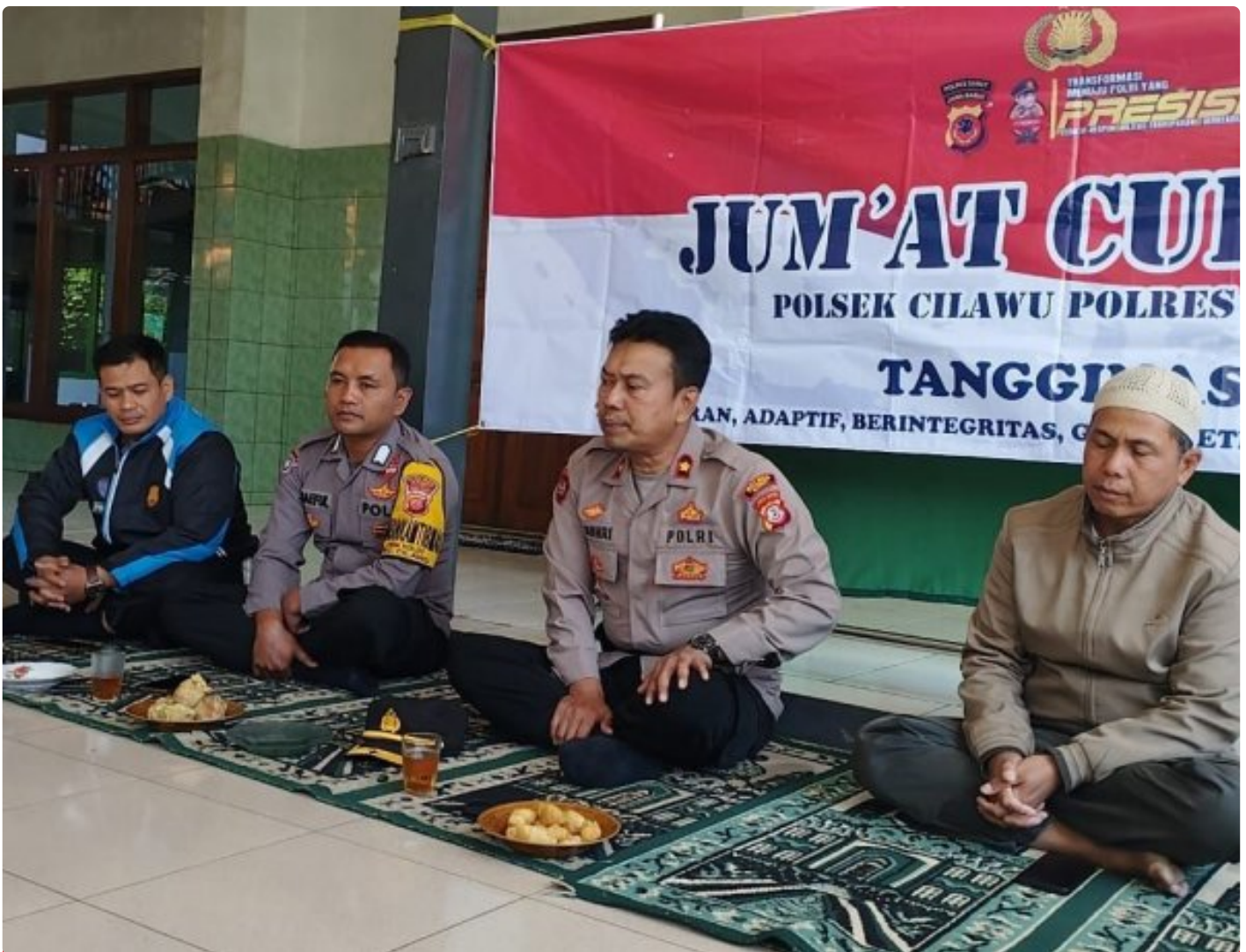
Kapolsek Cilawu mendengarkan curhatan warga